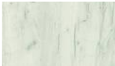
K001 Dub Bílý B kategorie