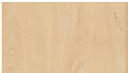
3840 Javor Mandala B kategorie