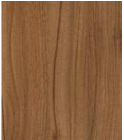
3734 Ořech Dijon B kategorie