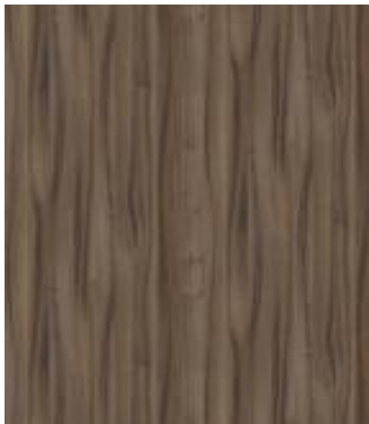
8953 Ořech Tiepolo B kategorie