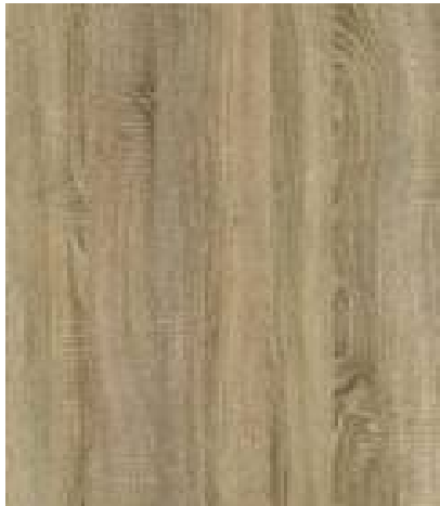
8197 Dub Platina B kategorie