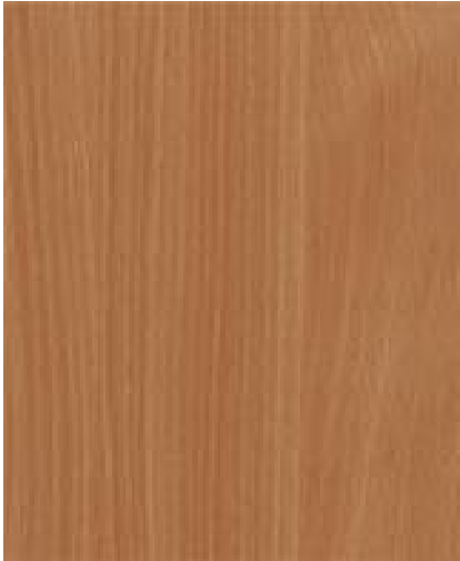
381 Buk Bavaria A kategorie