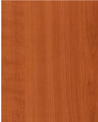
344 Třešeň A kategorie