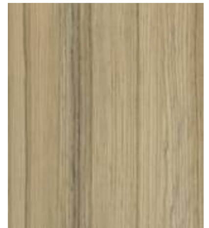
8995 Kokos Bolo B kategorie