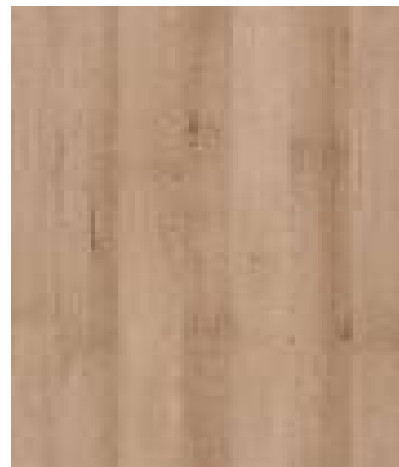
K013 Buk Pískový B kategorie